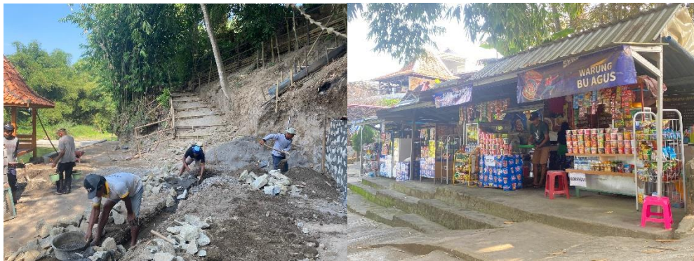
Gambar 02. Manfaat ekonomi dan kesempatan kerja di Umbul Sidomulyo

memilih berjualan di sana karena penghasilan yang cukup, terlebih pada hari libur ketika pengunjung membludak dan banyak yang berbelanja di warung. Pendapatan kotor Umbul Sidomulyo pada hari libur bisa mencapai lebih dari 1 juta rupiah, sedangkan pada hari biasa ( weekdays ) bisa mencapai 200-400 ribu rupiah, tergantung jumlah pengunjung. Selain itu, Umbul Sidomulyo juga menyediakan pekerjaan lain seperti pengelolaan lahan parkir dan pemeliharaan area wisata. Beberapa warga dipekerjakan untuk menjaga lahan parkir, memastikan kendaraan pengunjung terparkir dengan aman dan tertib. Di samping itu, ada pula warga yang bertugas membersihkan area umbul dan menjaga kebersihan Umbul. Penambahan infrastruktur juga dipekerjakan kepada warga pemilik saham dan warga setempat. Dengan kehadiran umbul, lapangan pekerjaan kian dekat dan terjangkau bagi warga. Tidak berlebihan jika disimpulkan Umbul Sidomulyo sebagai potret pro poor tourism .