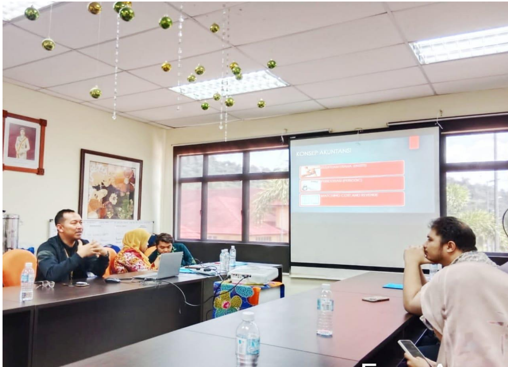
Gambar 1. Presentasi di depan pengrajin