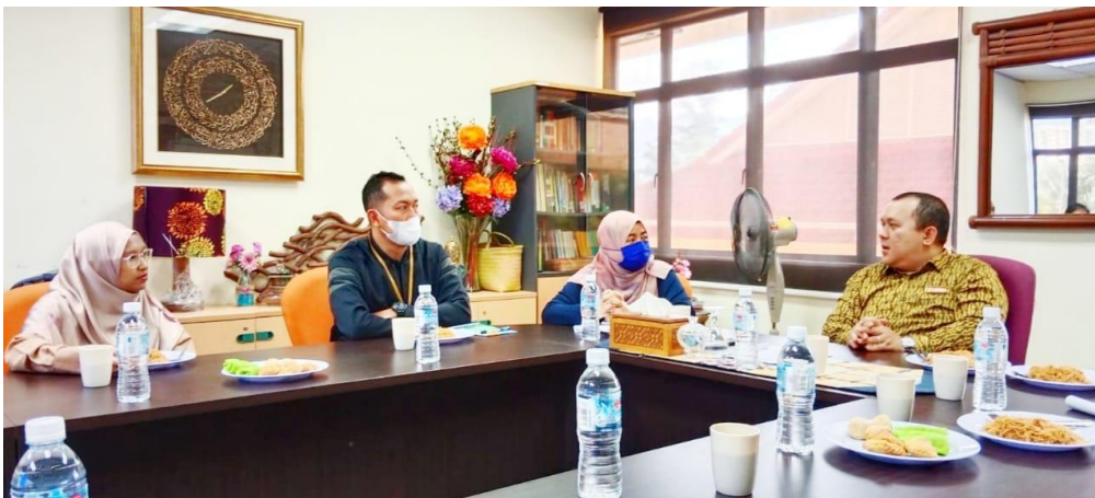
Gambar 2. Diskusi dengan Pimpinan Kraftangan Malaysia yang membawahi UMKM di Selangor Malaysia