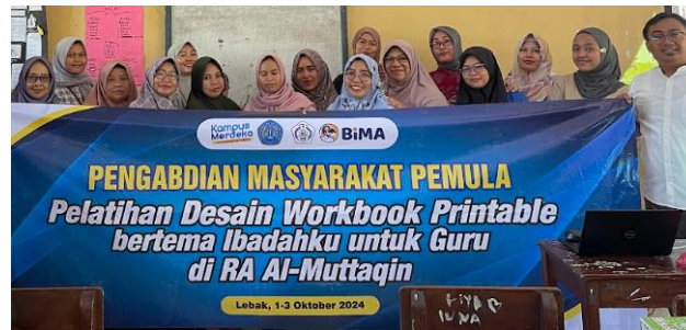
Gambar 5: Pelatihan Desain Workbook Printable bertema Ibadahku untuk Guru di RA Al-Muttaqin