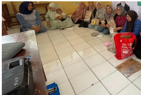
Gambar 6: Hasil kegiatan diadopsi oleh sekolah lain