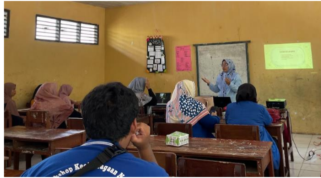
Gambar 4: Pelatihan Desain Workbook Printable bertema Ibadahku untuk Guru di RA Al-Muttaqin