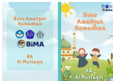
Gambar 8: visualisasi workbook

Visualisasi workbook tersebut terlihat seperti contoh di bawah ini: