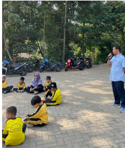
Gambar 7: Implementasi kegiatan kepada anak

Gambaran ipteks yang akan diimplementasikan pada kegiatan pengabdian kepada masyarakat ini adalah berupa softskill yang dimiliki oleh guru di RA Al-Muttaqin serta printout workbook bertema ibadahku sebagai hasil dari pelatihan tersebut. Buku ini akan dimanfaatkan oleh siswa di lingkungan RA Al-Muttaqin serta siswa di sekolah RA lainnya. Softskill merupakan perilaku interpersonal yang dibutuhkan dalam upaya pengembangan dan pengoptimalkan kinerja.