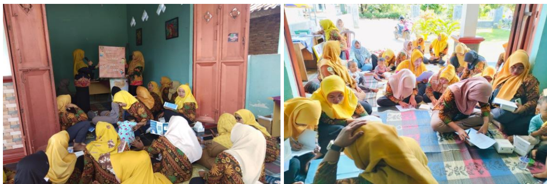
Gambar 2. Dokumentasi Kegiatan Sosialisasi