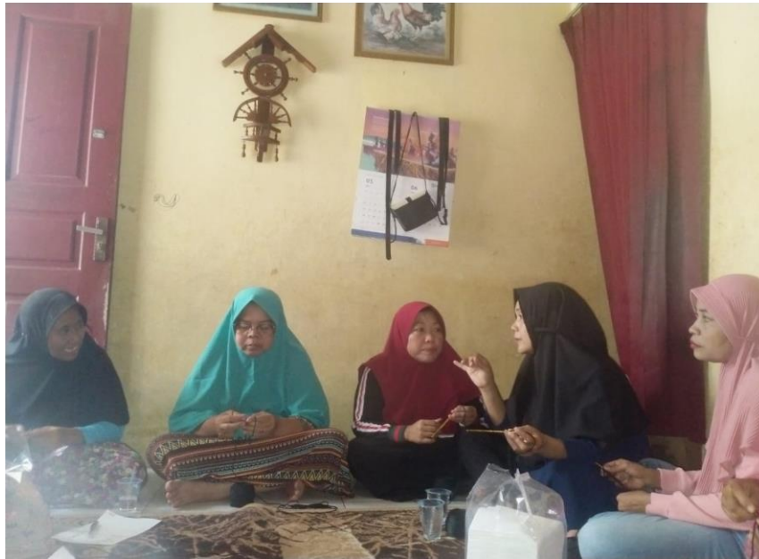
Gambar 1: pemaparan materi tentang kewirausahaan dan ekonomi kreatif ketua serta anggota PKM

Langkah awal kegiatan pengabdian kepada masyarakat ini yakni pemaparan materi tentang kegiatan kewirausahaan dan menjadi seorang wirausaha. Hal ini dilakukan untuk menambah pengetahuan dan wawasan terkait berwirausaha, memulai dan langkah – langkah yang dilakukan dalam menjalankan usaha, cara memasarkan produk yang sudah dibuat sehingga nantinya ibu – ibu kelompok mawar dapat menambah pendapatan keluarga.