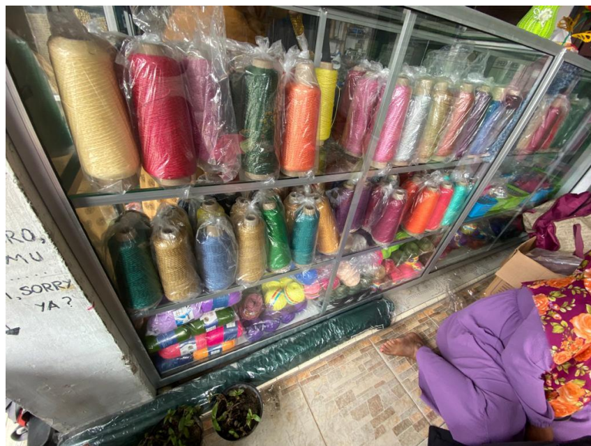
Gambar 2 : pembelian alat – alat untuk membuat tas dari tali kur untuk nantinya diserahkan kepada ibu- ibu kelompok mawar

Langkah awal kegiatan pengabdian kepada masyarakat ini yakni pemaparan materi tentang kegiatan kewirausahaan dan menjadi seorang wirausaha. Hal ini dilakukan untuk menambah pengetahuan dan wawasan terkait berwirausaha, memulai dan langkah – langkah yang dilakukan dalam menjalankan usaha, cara memasarkan produk yang sudah dibuat sehingga nantinya ibu – ibu kelompok mawar dapat menambah pendapatan keluarga.