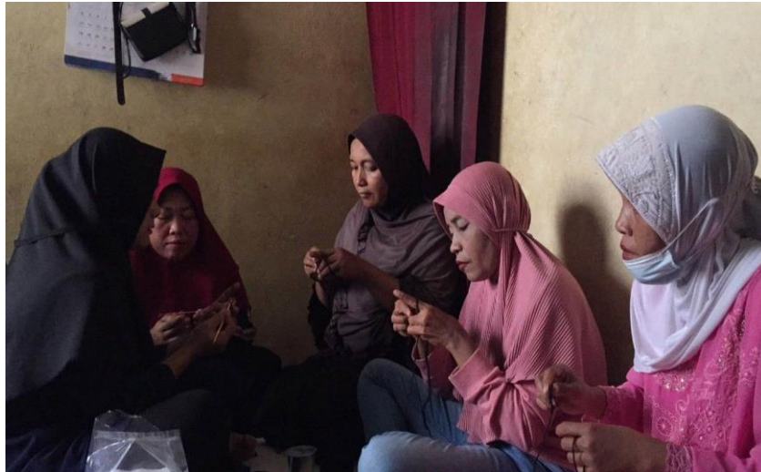
Gambar 3 : ibu – ibu kelompok mawar sedang melakukan pelatihan pembuatan tas dari tali kur

Pengadaan barang berupa alat – alat pembuatan tas dari tali kur mulai dari bahan seperti tali kur sebanyak lima kilogram, jarum rajut satu kotak, kain satin 2 meter, dan busa ati 1 meter. Barang – barang yang diserahkan ini tentunya akan memudahkan ibu- ibu kelompok mawar dalam melaksanakan pelatihannya.