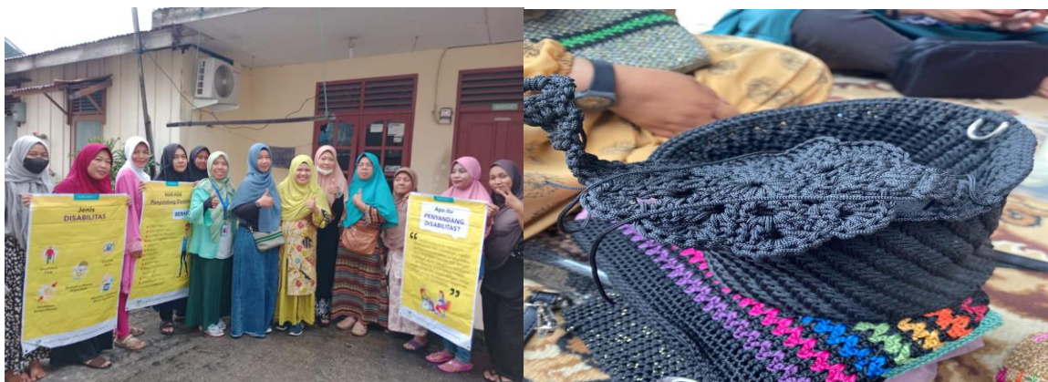
Gambar 4 : foto bersama setelah kegiatan pelatihan selesai dan bentuk dari tas dari tali kur yang sudah selesai.

Selanjutnya kegiatan pelatihan dipandu instruktur yang ahli dalam membuat tas dari tali kur. Anggota kelompok Mawar juga terlihat antusias dengan mengikuti pelatihan kerajinan tangan serta sangat senang karena adanya bantuan yang telah diberikan. Istinab selaku pendamping PKH dalam kelompok ini sangat mengapresiasi kegiatan PKM ini mengatakan bantuan seperti alat-alat kerajinan tangan ini sangat membantu kelompok-kelompok PKH dalam memenuhi keterampilan softskill yang kiranya bisa menjadi sumber penghasilan keluarga.