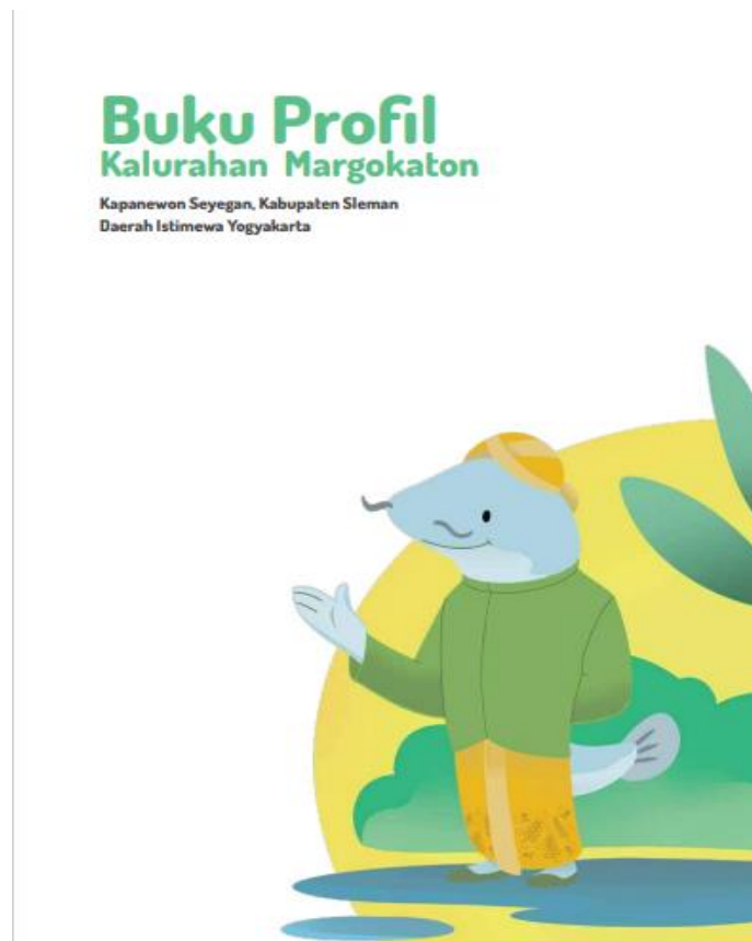
Gambar 2. Desain Cover Buku Profil Desa