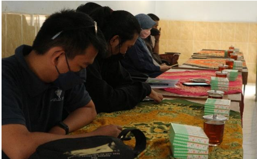
Gambar 1. Pelatihan Pengolahan Data dan Pembuatan Buku Profil Desa