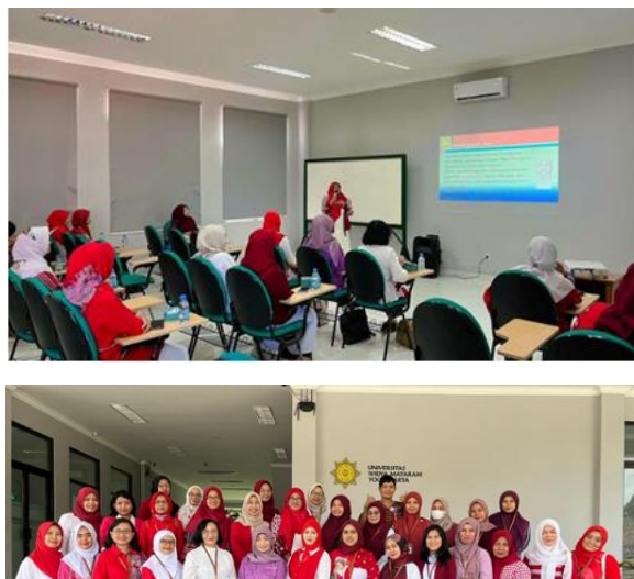
Gambar 3. Sesi FDG dan Foto Bersama Peserta

Hasil FDG dapat diketahui bahwa UMKM di lingkungan Universitas Widya Mataram (UWM) sebagai induk organisasi belum secara legal menjadi binaan IWWAMY, namun dalam kenyataannya beberapa UMKM di lingkungan UWM telah mendapatkan binaan dan pendampingan dari civitas akademika UWM, seperti tugas pendampingan pada mata kuliah Akuntansi UMKM, Kewirausahaan, Manajemen, dan penyelenggara pengabdian masyarakat dari dosen penerima hibah. Melihat situasi ini maka anggota IWWAMY perlu melakukan pendampingan secara resmi dan menjadi agenda berkelanjutan guna meningkatkan ekonomi pelaku usaha perempuan di lingkungan UWM, serta menjadi sara merintis usaha bagi anggota IWWAMY itu sendiri.