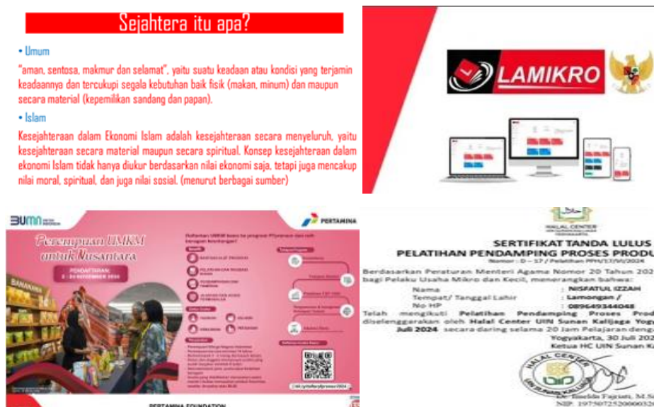
Gambar 4. Cuplikan Materi Presentasi Pengabdian

Akhirnya pemberian bekal persiapan menjadi pelaku UMKM dan Pendamping UMKM juga diberikan motivasi hidup sejahtera bagi keluarga dan lingkungan, serta informasi kemudahan zaman sekarang dalam penggunaan aplikasi-aplikasi gratis, seperti; aplikasi penjualan online dan layanan pemasaran yang memadai di HAWWABIZ dari Bank Indonesia Indonesia, Lapoan keuangan otomatis LAMIKRO, cara memperoleh hibah pelatihan gratis dari pemerintah dan tambahan modal dari Pertamina, sertifikat halal gratis dan mudah, sebagaimana cuplikan tangkapan layar presentasi berikut ini: