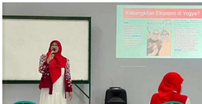
Gambar 2. Pemaparan Materi oleh Dosen Pengabd

Pemaparan materi memberikan sosialisasi keberadaan Pendamping UMKM. Sosialisasi ini meliputi informasi pentingnya UMKM Naik kelas dan Pendamping UMKM dengan menyampaikn beberapa informasi seperti berikut ini: 1) Menteri Koperasi dan UMKM Republik Indonesia (pada Juni 2021) Teten Masduki mengatakan, dalam mendampingi UMKM, minimal 10 ribu relawan pendamping dapat dicapai pada akhir tahun ini. Hal itu diperuntukkan untuk menjangkau 40 ribu UMKM yang ada di Indonesia. 2) Target digitalisasi sampai 2024 adalah 30 juta pelaku usaha, dan sekarang sudah sekitar 13,5 juta yang sudah terhubung ke ekosistem digital. 3) Melalui target tersebut sektor pertanian, ditargetkan sebanyak 33,4 pelaku usaha, pedagang pasar 12,6 juta, warung tradisional sebesar 3,5 juta, serta pedagang kaki lima sebanyak 26,7. 4) Pada program Trans to Me Geber UMKM dilakukan kolaborasi untuk merekrut relawan pendamping bersama asosiasi dalam mendampingi pelaku UMKM untuk mengakses kemudahan perizinan usaha agar legalitas usaha para UMKM terjami. 5) Adapun melalui transformasi usaha mikro, pemerintah bekerjasama dengan platform e-commerce baik lokal, homogen, maupun level nasional, untuk memberikan edukasi digital dan menyediakan tempat kepada UMKM melalui platform tersebut.