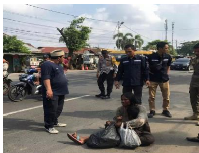
Gambar 1 : Tim penjangkauan melakukan tugas

Adapun tahapan Tim Penjangkauan ini ialah pendataan, sebagaimana tujuannya untuk mengetahui identitas dari objek Tim Penjangkauan yang kemudian akan dikelola oleh Dinas Sosial lalu berdasarkan data yang didapat Tim Penjangkauan membuat pengajuan untuk menampung untuk sementara waktu. Dalam merekomendasi penempatan inilah Tim Penjangkauan menaruh Anak Jalanan, Gelandangan dan Pengemis di Panti Pemerintah yang tepat, selanjutnya di dalam panti pemerintah inilah 56 akan dilakukan pendampingan lanjutan dan proses asesmen dalam rangka memenuhi hak anak jalanan, gelandangan dan pengemis yaitu terkait dengan kondisi, kebutuhan dan lembaga pelayanan yang dirujuk. Selanjutnya melakukan pelayanan hak, disini Panti Pemerintah bertugas merujuk Anak Jalanan, Gelandangan dan Pengemis kepada Dinas Sosial yang kemudian pengembalian ini dilakukan setelah orang tua atau keluarga asal dinilai siap untuk menerima kembali mulai dari kondisi mental, kondisi lingkungan, dan kondisi ekonomi. Kemudian dalam tahap akhir yaitu pengawasan, dimana Dinas Sosial mengawasi penerapan prinsip perlindungan, standar pelayanan, standar pengasuhan di panti oleh orang tua atau keluarga asal secara berkala. Jika ditemukan adanya pelanggaran maka Dinas Sosial berhak menarik dan mengalihkan penempatan dan menjatuhkan sanksi administratif.