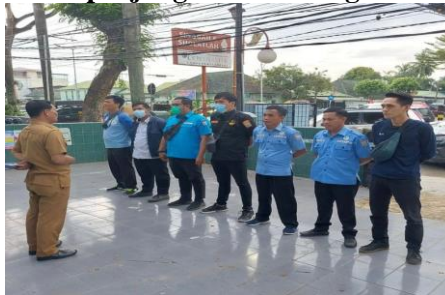
Gambar 2 : Tim penjangkauan sedang diberikan arahan

Dari Beberapa Narasumber Yang Saya Wawancara di dinas Sosial Menghasilkan kesimpulan bahwa sasaran kebijakan serta hasil observasi yang dilakukan penelitian selama satu bulan melakukan kegiatan Praktek Kerja Lapangan, hal itu berbanding terbalik dengan pernyataan ketiga implementor dari Dinas Sosial. Adanya temuan tindakan kekerasan yang dilakukan oleh tim penjangkauan pada pengemis dan gelandangan yang tidak ingin ditangkap dan dibina oleh tim penjangkauan. Mereka mengalami tindakan kekerasan berupa pukulan dan bentakan.