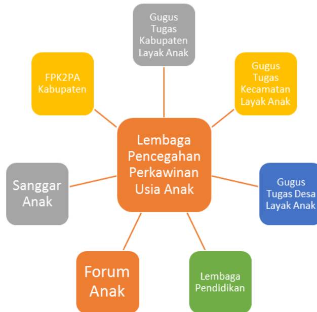
Gambar 2 . Kelembagaan Pencegahan Perkawinan Usia Anak di Kabupaten Konawe Selatan

implemmtasi kebijakan tersebut. Diantaranya, gugus tugas layak anak mulai dari tingkat kabupaten hingga desa, lembaga pendidikan, forum anak, sanggar anak, hingga organisasi pemerintah dan organisasi masyarakat lainnya yang berkepentingan. Untuk lebih jelasnya, berikut disajikan data lembaga/instansni yang terlibat dalam implementasi kebijakan pencegahan usia anak di Kabupaten Konawe Selatan.