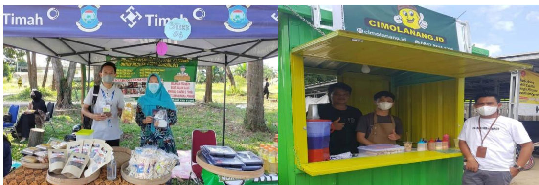
Gambar 2. Pendampingan Para Konsultan PLUT Bidang Pemasaran ke Pelaku UMKM di Lapangan

Berdasarkan penjelasan diatas bahwa terdapat beberapa program yang sudah dilaksanakan, dalam kolaborasi digitalisasi diantaranya program pendampingan digitalisasi pemasaran langsung kelapangan seperti pada dokumentasi berikut ini;