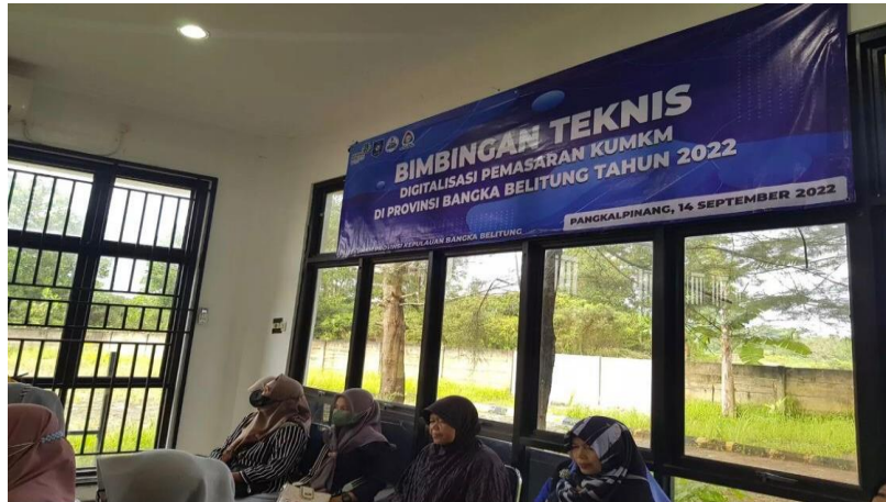
Gambar 1. Bimbingan Teknis Digitalisasi UMKM oleh PLUT Babel