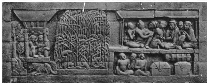
Gambar 1: Relief Karmawibhangga dengan kode O.65.

Komoditi yang diperdagangkan dapat dibedakan oleh “ produksinya ”, yaitu produksi primer dan produksi sekunder. Bidang primer, seperti pertanian, peternakan, dan perikanan, sedangkan bidang sekunder meliputi industri kecil yang diusahakan para perajin ( misra ) baik dalam bentuk logam maupun non logam. Aktivitas produksi dalam bentuk komoditas padi sebagai hasil pertanian dan proses distribusi barang dagangan dapat diketahui dari salah satu relief Karmawibhangga di Candi Borobudur sebagaimana gambar relief Karmawibhangga O.65 dan O.43: