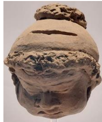
Gambar 2: Celengan Bentuk Kepala Manusia dari Tanah Liat

Selain menyimpan hasil panen, berdasarkan hasil dokumentasi di Museum Sonobudoyo dapat diketahui bahwa masyarakat Mataram Kuno juga telah mengenal sistem “ menabung ”, yaitu sebuah cara menyimpan atau menyetor sebagian pendapatan uang dengan menggunakan wadah penyimpanan khusus uang berbahan tanah liat yang dibakar. Tempat penyimpanan ini dikemudian hari pada masa Kerajaan Majapahit (Abad ke XIII-XVI M) disebut dengan “celengan”. Penyebutan celengan, karena bentuk yang digunakan saat itu kebanyakan bentuk manusia atau hewan, seperti hewan celeng dalam mitologi China atau disebut babi dalam bahasa Jawa yang merupakan binatang dalam kepercayaan Hindu-Buddha diyakini sebagai Dewa Kuwera yang merupakan dewa kekayaan atau kemakmuran (Radar Mojokerto.Jawa Pos.com, 2023). Berikut ini Celengan berbentuk kepala manusia yang periset temukan di Museum Sonobudoyo: