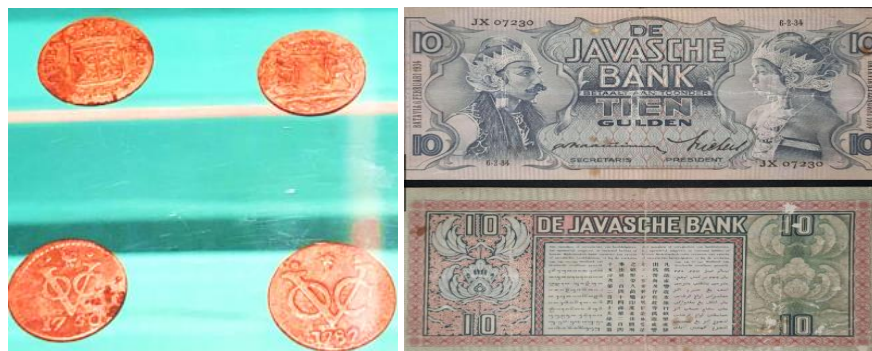
Gambar 9: Uang Logam dan Uang Kertas VOC

Adapun beberapa peninggalan bukti transaksi ekonomi pertengahan era Mataram Islam bisa periset tampilkan berdasarkan dokumentasi Museum Sonobudoyo, seperti gambar mata uang pertama berupa koin logam yang dicetak VOC pada tahun 1726 M dan mata uang kertas gambar wayang dikeluarkan oleh De Javasche Bank yang konon dibuat untuk mengambil hati rakyat bumi putera yang menilai wayang sebagai budaya adiluhung meskipun akhirnya menjadi seri gambar uang terakhir sebelum kekuasaan beralih ke Jepang tahun 1942 M.