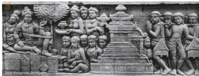
Gambar 3: Relief Karmawibhanga dengan kode O.43.

Adapun relief yang menggambarkan cara “ distribusi ” barang dagangan pada masyarakat Kerajaan Mataram Kuno dengan cara memikul bagi pedagang laki-laki atau digendong dengan bakul jika pedagang perempuan yang merupakan cara untuk menjajakan dagangan mereka kala itu, sebagaimana pada gambar relief kode O.43. dan diperkuat dengan lukisan gambar 4 berikut ini: