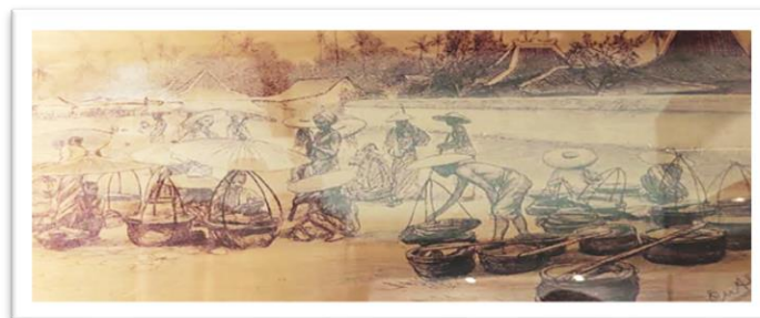
Gambar 4: Lukisan Aktivitas Berdagang dengan Pikulan

Sementara itu “ transportasi ” dalam bidang ekonomi digunakan untuk mengangkut masalah produksi, pertukaran, distribusi, dan konsumsi, bahkan mengangkut orang yang dihubungkan dengan jembatan antar desa untuk jalur darat dan menggunakan perahu yang menghubungkan kedua tepi sungai. Sedangkan “ transaksi ” dalam masyarakat Jawa Kuno bisa dilihat dalam dua bentuk, yaitu pertama, dalam bentuk “barter” yang didasarkan atas perbandingan satuan atau pertukaran barang yang