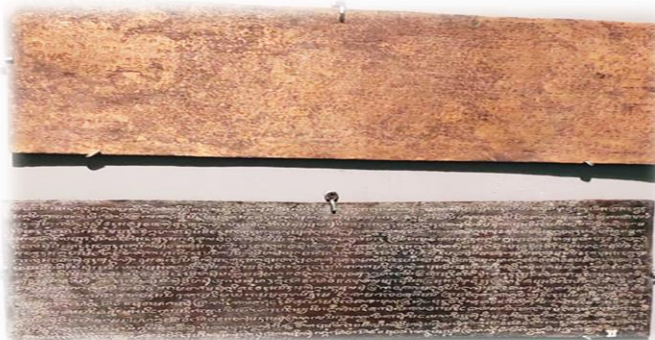
Gambar 8: Prasasti Penggumulan” A dan B”

Klausul-klausul sîma mengatur jumlah pedagang atau pengrajin yang bebas pajak dan mengatur volume perdagangan atau produksi yang tidak dikenakan pajak. Misalnya, jika jumlah barang dagangan lebih dari yang ditentukan maka sisanya itu dikenai pajak. Aturan penetapan sîma dan pasaran dapat dilihat pada prasasti “Penggumulan” A dan B, yang merupakan sumber sejarah informasi struktur sosial, ekonomi, dan budaya masyarakat Mataram Kuno lebih tepatnya masa pemerintahan raja Balitung (Balitung) tahun 824 saka (902 M) atau awal abad ke X M.