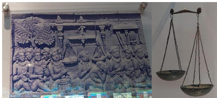
Gambar 6: Miniatur Relief Timbangan dan Timbangan Logam

Logam selain untuk mata uang juga digunakan sebagai alat ukur ( matric ). Masyarakat Jawa Kuno telah mengenal dan memiliki pengetahuan tentang ukuran yang detil. Melalui prasasti dan juga artefak menunjukkan adanya ukuran berat logam mulia yang diselaraskan dengan mata uang emas, perak, dan besi, seperti; Kati , Tahil , Masa , dan Kupang sebagai ukuran satuan gram seperti emas atau perak dengan menggunakan timbangan ukuran kecil, seperti dokumentasi gambar 6 berikut ini: