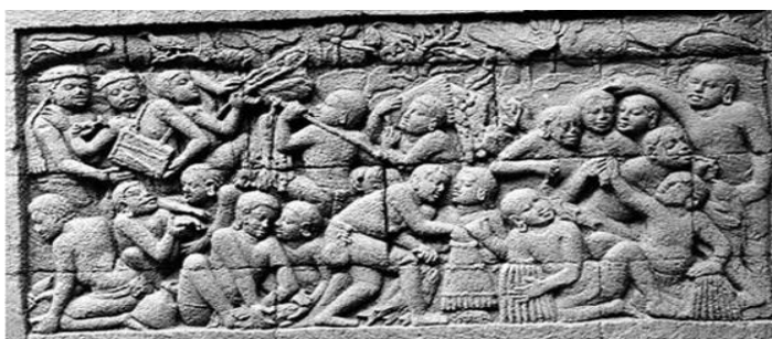
Gambar 7: Relief Karmawibhanga Ilustrasi Keramaian Pasar Tradisional