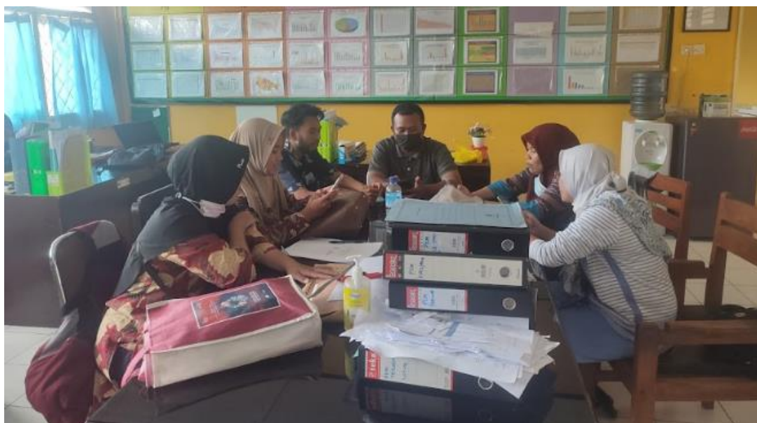
Gambar 1. Tahap Persiapan Melalui Wawancara Permasalahan Mitra