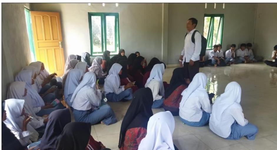
Gambar 2. Tahap Persiapan Melalui Wawancara Permasalahan Mitra

Berbagai informasi tentang perilaku bullying dan bentuk-bentuk perlindungannya bagi korban tidak hanya disampaikan melalui presentasi, juga melalui menayangkan video tentang bentuk dan akibat dari perilaku mengintimidasi. Para peserta nampak terpicat dan mulai memahami konsep intimidasi yang dipaparkan.